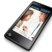
MyChart By Epic

Descargue la aplicación MyChart, de EPIC, en su teléfono. Una vez descargada la aplicación, busque "WNCCHS" e inicie sesión con su nombre de usuario y contraseña de MyChart.